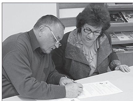
Az együttműködési szerződés megerősítésének pillanata

>> FOLYTATÁS A 1. OLDALRÓL A verseny után — az eddigi hagyományoknak megfelelően — mindkét tanterület kölcsönösen megajándékozta egymást. A csíkszeredaiak egy székely zászlót hagytak iskolánkban, mi pedig könyvekkel és egyéb kiadványok-