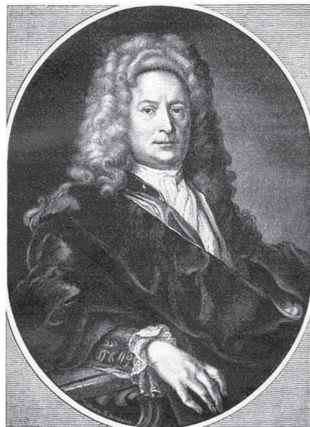
Johann Georg Freiherr von Harruckern (Schenskenfeld, 1664. – Bécs, 1742.) Korabeli rézmetszet.

vőségnél vállalt hivatalt, mint számviszt. Hamarosan a főhadbiztossághoz került, ahol a hadsereg élelmezési biztosa lett. A hadseregnél végrehajtott élelmezési reformja jelentős megtakarításokat eredményezett az udvarnak, mely elismerésül III. Károly magyar királytól előbb udvari kamarai tanácsosi tisztséget, majd később bárói címet kapott. Ezzel járt a kincstárra visszaáramlott, gazdátlanra vált javak juttatása is Békés vármegye, Csongrád vármegye és Zaránd vármegye területén. Többek között az ő tulajdonába került a gyulai vár is. 1729-től főispán volt Békés vármegyében. Az ő nevére kiállított, 1723-ban kelt királyi adománylevél Kígyóst már pusztaként említi. A gyulai uradalomhoz tartozó majorként állattartással, kisebb részét földműveléssel, szőlőültetéssel hasznosították. A gazdasági személyzet részére a pusztá keleti részén gazda-