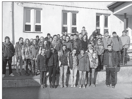
Újra találkoztak a szeredai és a kigyósi kézisek

címet is megszerezte. A lányok harmadikok lettek, a vendéglátóinkat könnyedén verték, de nem bírtak a Szárhegygel és Csíkszereda város ifjúsági csapatával.