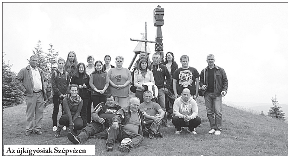
Az újkígyósiak Szépvízen

lábat és harangot, valamint az egykori kápolna régészetileg feltárt és újjáépített kőalapzatát. A borongós, esős idő miatt a Szent László római katolikus templomban gyűltek össze a szépvízi és környékbeli hívők, illetve az újkígyósi vendégek. A szentmise végén a Tengelic Énekegyüttes előadásában, orgonakísérettel hallhattunk két Szent László-éneket.