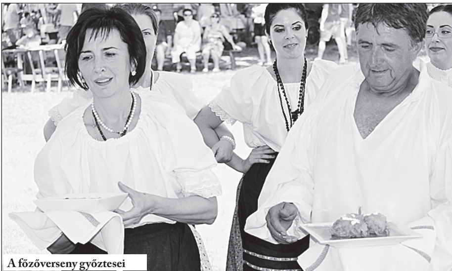
A főzőverseny győztesei