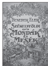
Székelyföldi mondák és mesék