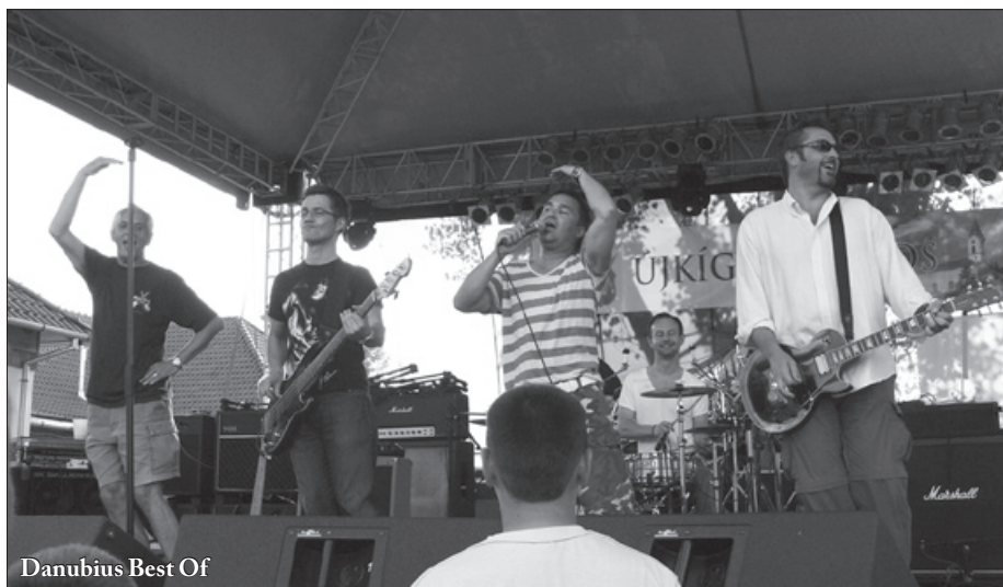
Danubius Best Of