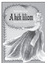
A kék lilium