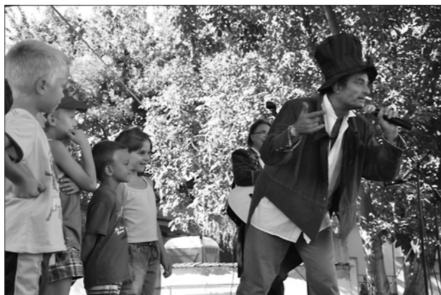
A Holló Együttes a gyerekeket is bevonta zenés műsorába