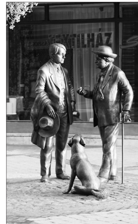
Rippl és Ady találkozása

Kaposvár Megyei Jogú Város Önkormányzata 2008-ban nyilvános jelígy pályázatot hirdetett egy háromalakos, életnagyságú bronz szoborcsoport 1/5-ös léptékű terveinek elkészítésére. A pályázati kiírásban többféle szempont szerepelt a szobrok elkészítésével