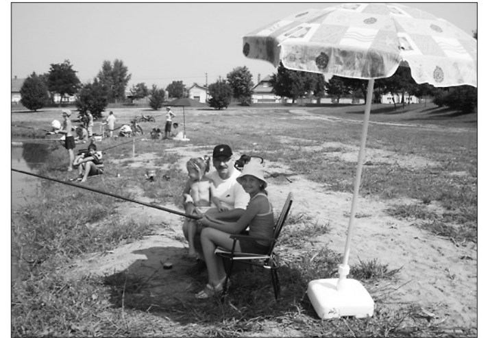
A horgászat nem csak a férfiak sportja

Rendezvényünk külső támogatók nélkül sokkal szerényebb lett volna.