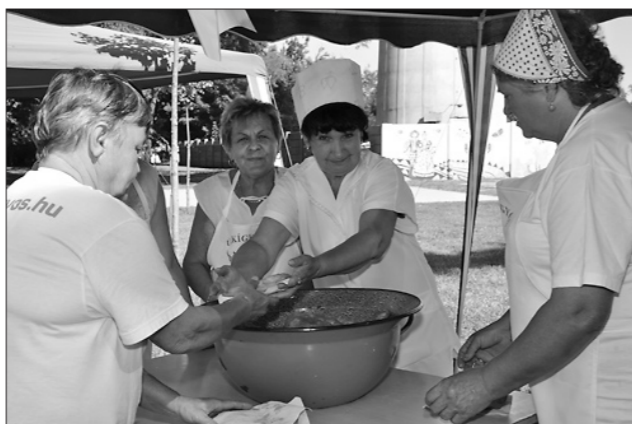
A civil szervezetek mindkét napon lángossal kedveskedtek a látogatóknak