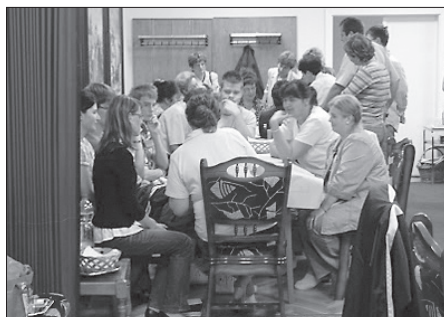
Fotók az első, a helyzetelemzést elvégző műhelyről

sebb-nagyobb csoportokban tekintették át Újkígyós helyzetét, vázolták fel a fejlesztés lehetséges irányait, szükséges lépéseit és vitatták meg, hogy kinek mit kell tennie annak érdekében, hogy a tervekből valóság legyen. Az 1. számú ábra a műhelyek témáit, céljait foglalja össze.