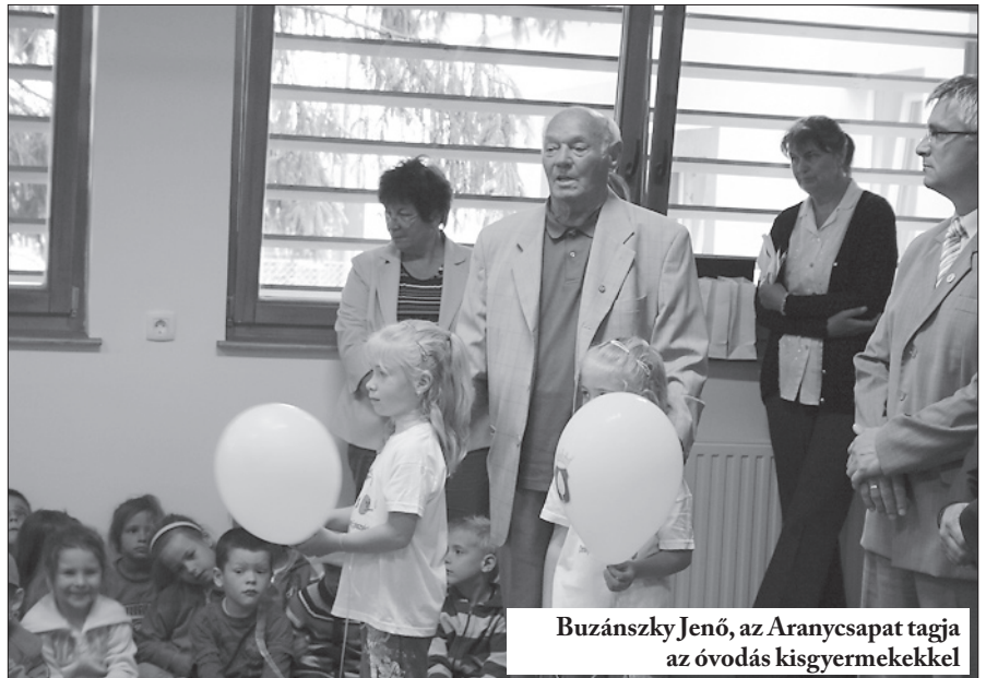
Buzánszky Jenő, az Aranycsapat tagja az óvodás kisgyermekkel

Később néhány évig az épület konditeremként működött, majd az iskolában nem használt eszközök kerültek elhelye-