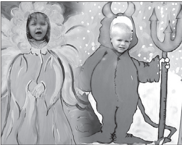
A mókás fotók készítéséért sem kell fizetni

Dél előtt fél tíztől várják az érdeklődőket, akiket fánkkal kínálnak, majd gyermekmúson szórakozhatnak. Ezt követően játékos családi és szellemi vetélkedőn mérhetik meg magukat a vállalkozó kedvűek. Az ebéd után újabb vetélkedőn vehetnek részt, melyet íjász- és break bemutató követ. Közben bekapcsolódhatnak az AWANA Klub foglalkozásába is. A napot szórakoztató gyermekmúsor zárja.