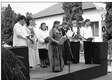
2007-ben a Tengelic Énekegyüttes is köszöntötte az elszármazottakat