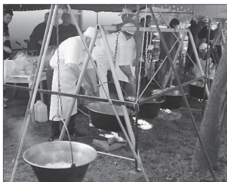
Rotyogott a pörkölt és az adrenalin a tavalyi hazavárón