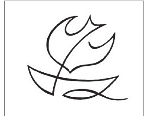
Simon András grafikája: A Lélek erejével (forrás: www.simongaleria.hu )

Szép dolgok is történtek 2008-ban. Rengeteg segítséget kaptunk a munkánkhoz, persze voltak olyanok is, akik gáncsokodtak. Nagyon sok ember fáradtságos munkája által tettük a napi feladatokat, azokat is, amelyek nem ilyen látványosak. Hiszen kinek tűnik fel az orvos, a hivatalnok, a tanár, az óvónő, a dadus vagy éppen a takarítónő munkája – legtöbbször csak akkor, ha valami