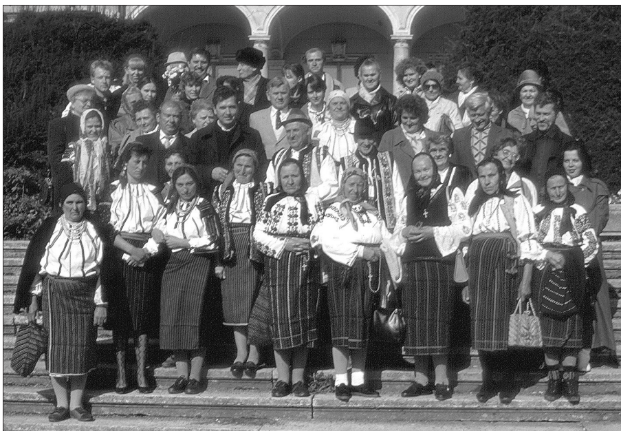
A 1992-es októberi népfőiskolai hétvégénk országosan is az elsők között volt a moldvai magyarságot bemutató ismeretterjesztő alkalmak sorában.