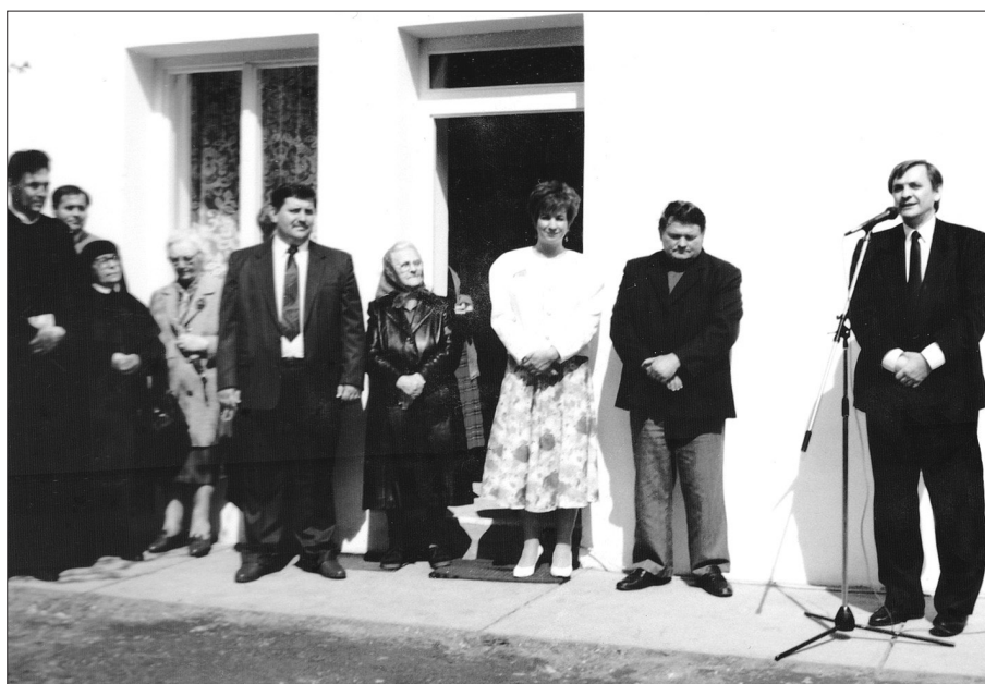
A Népfőiskola székházának avatóján 1994. április 9-én Lezsák Sándor mondott beszédet.