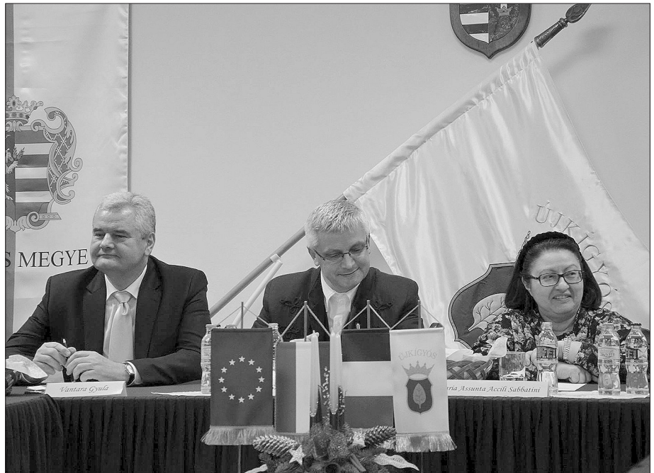
Vantara Gyula országgyűlési képviselő, Szebellédi Zoltán polgármester és Maria Assunta Accili, az Olasz Köztársaság magyarországi nagykövete

akkor remélhet jobb jövőt, ha polgárai képesek közös erőfeszítéssel felelősséget vállalni a közjóért.” Azt gondolom, hogy a most Európa egészét szorító problémákra is csak a közös akarat, az összefogás, a közös cselekvés fog igazi megoldást biztosítani.