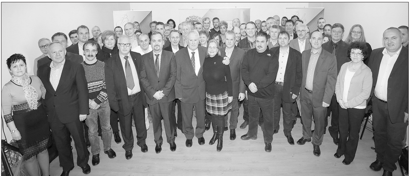
Több mint száz polgármester és szakember vett részt a nyílt napon

A fórum nagy érdeklődés mellett zajlott, a regisztrációk alapján több mint száz polgármester és szakember fogadta el a megyei önkormányzat meghívását, és vett részt a nyílt napon. Zalai Mihály, a Békés Megyei Önkormányzat Közgyűlésének elnöke kiemelte: akkor lennének elégedettek, ha Békés megye a források lehívásában az ország öt legjobb megyéje között szerepelne.