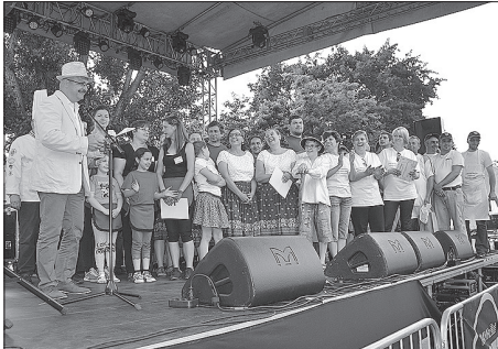
A főzőverseny eredményhirdetése a győztes csapatokkal