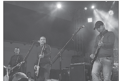
A Republic együttes nagyszerű koncertje a nagyszínpadon