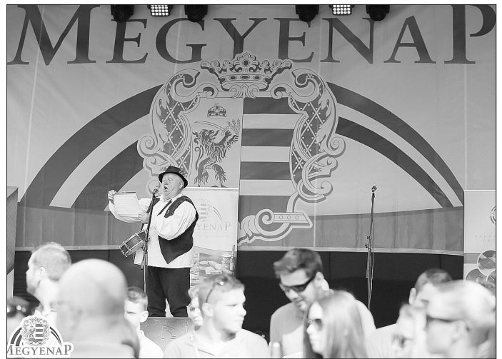
A nap szlogenje: Hagyomány, érték, közösség

A Megyenap délelőttjén a színpadon a Békés megyei nemzetiségek mutatkoztak be, zene, tánc, ének, vers követte egymást a németek, romák, szlovákok, románok, szerbek tolmácsolásában. Délben a Békéscsabai Napsugár Bábszínház Rongy Elekről mesélt a gyerekeknek, majd ünnepélyes esemény következett: érték-