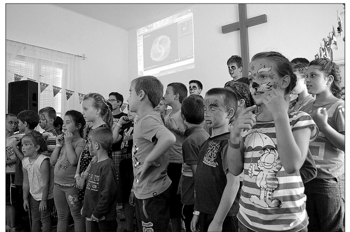
A tábori beszámolóra szeretettel vártuk a hozzátartozókat

Sokan jelezték, hogy remélik, jövőre is lesz Mosoly Tábor. Ezekből a hozzászólásokból arra következtetünk, hogy a gyerekek nagyon jól érezték magukat. :) Reméljük, jövőre is lesz lehetőség a tábor megszervezésére!