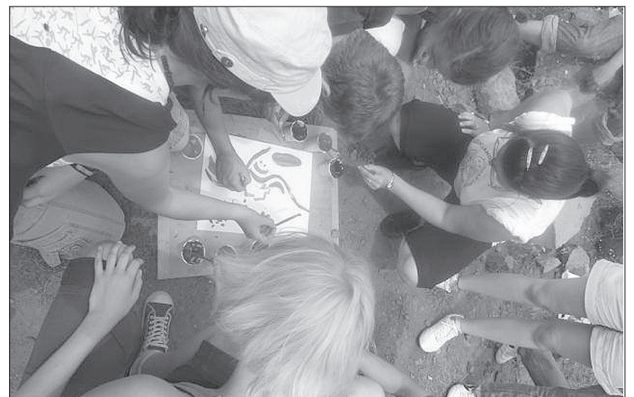
Közös munka, közös élmény

Nem bántam meg. Valamilyen formában mai napig az életem része maradt a közösség. Először gyermektáborokban,