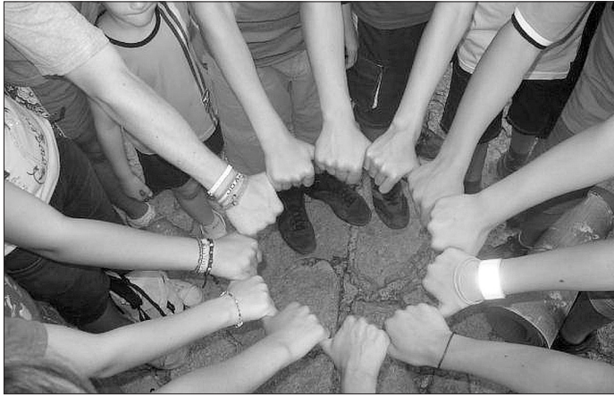
Egy csapat vagyunk

2006-tól kamasztáborokban voltam résztvevő, 2008-tól pedig magam is vezettem már gyerekcsoportokat. Idén a helyi szervezésben van szerepem, így a tábormenet újabb oldalába nyerek betekintést.