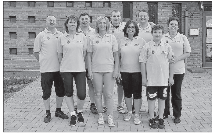
A háromszor három Újkígyósi Tekergő