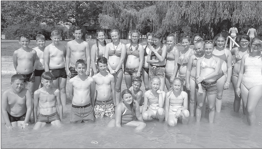
Újkígyósiak a Balatonnál