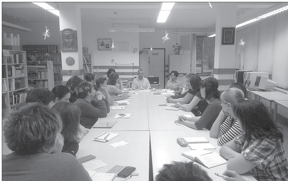
A tanév első megbeszélésére a polgármestert és az intézményvezetőt is rendszeresen meghívjuk

tunk a Narancs díjhoz, a „Zárd aapot futással,„ elnevezésű rendezvényünkhöz, a Pedagógus napi figyelmességéhez és az év végi jutalmazásokhoz.