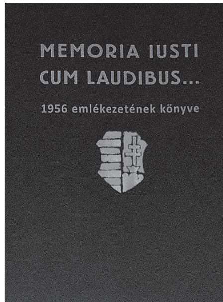
Az iskolai előadás alapjául is szolgáló könyvet Harangozó Imre szerkesztette

— Alapvetően bosszantott, amikor azt mondták, Újkígyóson nem történt semmi, miközben a hagyományos értelemben vett parasztság, pontosabban a paraszti életforma és annak értékrendje az 1945 utáni évtizedekben eltűnt hazánkból. A kimondott és kimondatlan emlékezet, a zsigerekbe oltott félelem pedig nem éppen arról árulkodott, hogy itt minden a legnagyobb rendjén volt.