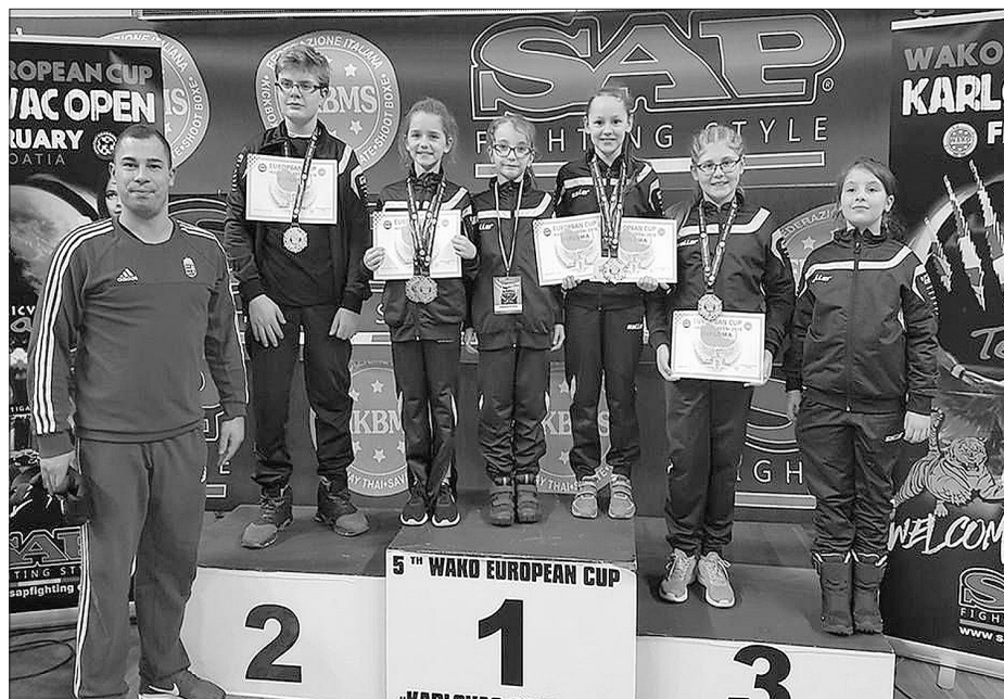
Sikeres újkígyósi szereplés Karlovacban

Két héttel később az egykori magyar koronázóváros adott otthont annak a nemzetközi versenynek, amely elsősorban a magyar, cseh, szlovák, lengyel és ukrán