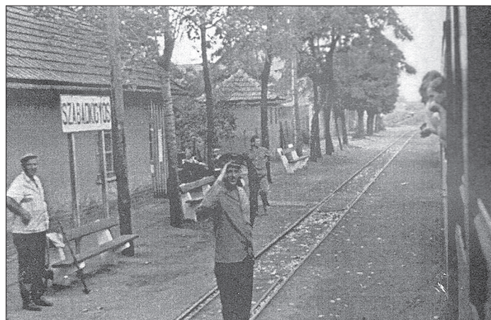
Több mint hét évtizedig közlekedhettek kisvasúton a kigyósiak