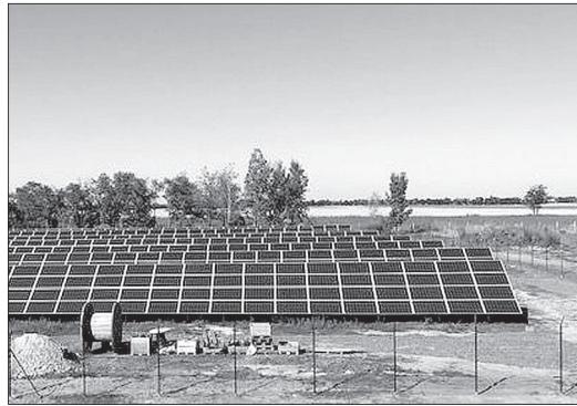
A fotovoltaikus (napelemes) rendszerek a nap energiáját alakítják át elektromos energiává

Az erőmű létesítése és üzemeltetése eduká-