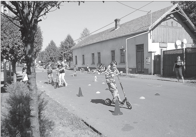
A versenyen minden diák részt vett, a legügyesebbek jutalmat kaptak

2018. szeptember 21-én az Újkígyósi Széchenyi István Általános Iskola is csatlakozott az Európai Mobilitási Hét rendezvényeihez: diákjainknak Autómentes Napot szerveztünk. A környezettudatos, helyes és biztonságos közlekedést népszerűsítő, szemléletformáló programunk megrendezéséhez az Innovációs és Technológiai Minisztérium pályázatán nyert támogatást Újkígyós Város Önkormányzata. Az előre meghirdetett esemény kapcsán többen „autómentesen” érkeztek iskolába, amiért jutalomban részesültek. A nap folyamán a kerékpár, a roller, a gördeszka és a görkorcsolya használata került előtérbe: ügyességi és gyorsasági versenyen mutathatták meg tudásukat tanulóink. A gyerekek KRESZ tudását az oktatást követően egy totó kitöltésével ellenőriztük. Ökos közlekedéssel kapcsolatos kézműves foglalkozásokat is szerveztünk: a kisebbek gyurmából, papírból vonatot, kerékpárt készítettek, rajzoltak, festettek; a nagyobbak társasjátékot és plakátot állíthattak össze. Reméljük, hogy programunk nemcsak önfeledt szórakozást nyújtott diákjainknak, hanem a környezetbarát és fenntartható közlekedés népszerűsítéséhez is nagymértékben hozzájárult!