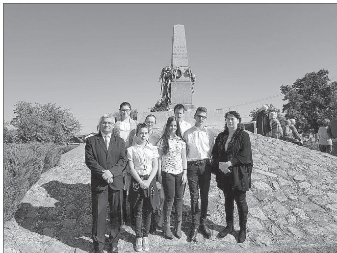
A Maros partján felépült vártól délre lévő Vesztőhelyen álló, 1881. október 6-án átadott obeliszknél egy-egy szál virággal emlékeztek a vértanúkra.

Emlékezz magyar! – buzdít a felirat az újkígyósi 1848-49-es emlékmű talapzatába építve. Ennek szellemében kerül sor évről-évre a diákokkal együtt az aradi látogatásra, hozzájárulva a nemzeti öntudat erősödéséhez.