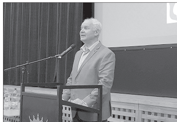
Herczeg Tamás országgyűlési képviselő

2019. február 4-én lakossági fórumot tartott az Önkormányzat, ahol Szebellédi Zoltán polgármester beszámolt az elmúlt év legfontosabb eseményeiről, valamint köszöntötte a tíz legtöbb helyi adót befizetőt és a tíz legnagyobb foglalkoztatót egy oklevéllel.