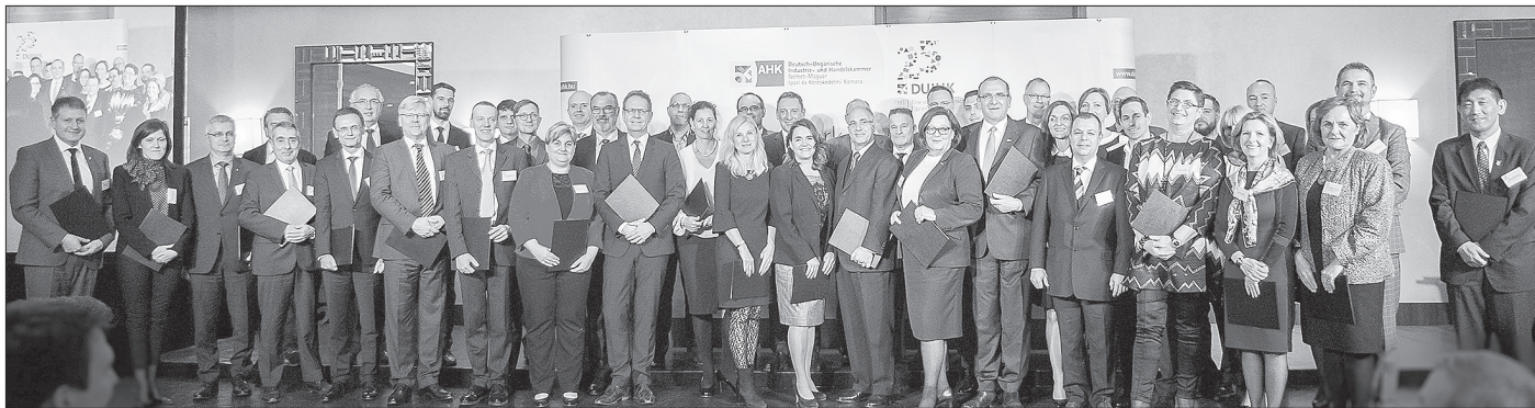
Az együttműködési megállapodást 42 kamarai tag írta alá

A Német-Magyar Ipari és Kereskedelmi Kamara és az Emberi Erőforrások Minisztériuma kezdeményezésére 42 kamarai tag is aláírta a Család és a Munka Összeegyeztettségéért együttműködési megállapodást, amelyre 2019. január 31-én került sor Budapesten a Marriott Hotelben.