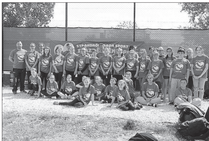
Egységes mezben az újkígyósi strandröplabdázók még 2019-ben

Szabadidősport ide vagy oda, itt is igazolással és érvényes sportorvosi vizsgálattal lehet részt venni a megméretéseken. Könnyített röplabdát képzeljünk magunk előtt. Először a „zsinórplabda” nevű játékkal kezdődik az oktatás, majd a röplabdázás alapérintéseit megtanulva, könnyített játék oktatásával zajlik a sportág technikájának megtanulása. Ez úgy valósul meg, hogy a röplabdában általános három érintés közül az egyik „fogható” érintés, tehát a nyitást vagy a fogadást követően megfogható a labda, majd innen elpattanó érintéssel továbbítható. Ugyanis lehetőség van könnyített szabályokkal is versenyezni, mérkőzéseken részt venni. Így az alapokat megtanuló gyerekek is könnyen sikerélményt szerezhetnek.