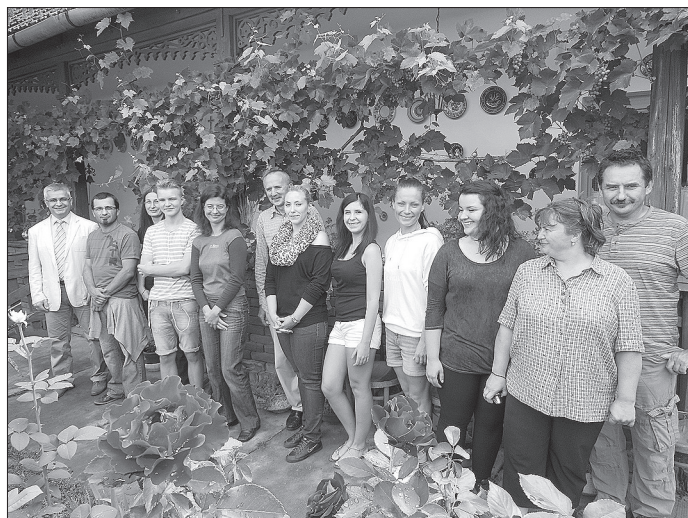
A tábor alkotói