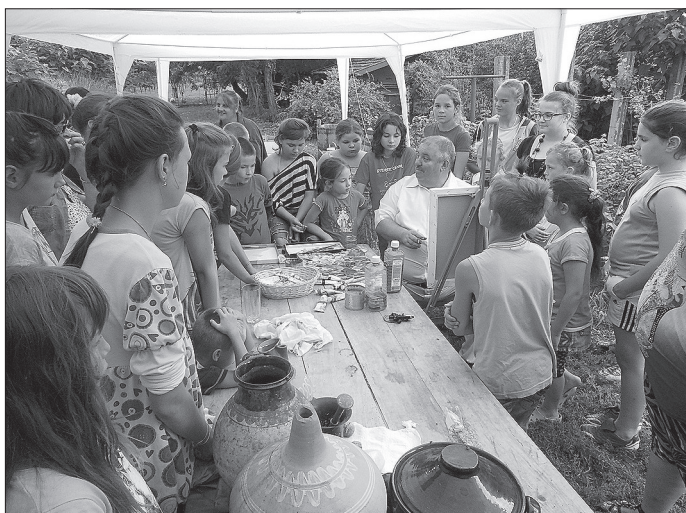
A gyerekek érdeklődéssel hallgatták az előadást

Az Újkígyós 200 éves programsorozat keretein belül 2014. július 28-tól augusztus 3-ig helyi művészeink foglalták el a Művésztanyát. Egy héten keresztül folyt a munka: festés, fafaragás, szövés, fotózás és agyagozás. Nagy izgalommal vártuk az első napot, hiszen, helyi művészek így együtt, első alkalommal találkoztunk szakmai keretek között. Csuta György békési festőművész levélben köszöntött minket, majd Szebellédi Zoltán polgármester úr kívánt aktív és alkotásokban gazdag hetet. Hamar átadtuk magunkat a hely szellemének, elindult az alkotói folyamat. Rendkívül