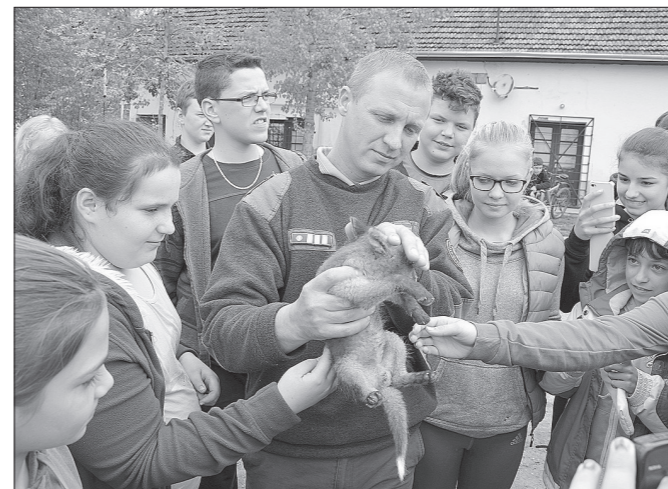
A gyermekek szívesen simogatták a rókakölyköt