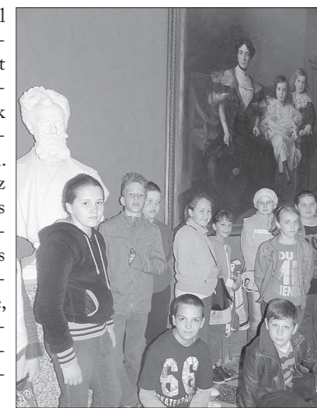
Az újkígyósi tanulók egy csoportja a Munkácsy Mihály Múzeum előcsarnokában

Az újkígyósi diákok e rendkívüli lehetőségen túl bepillanthattak a múzeum állandó kiállításának anyagaiba is.