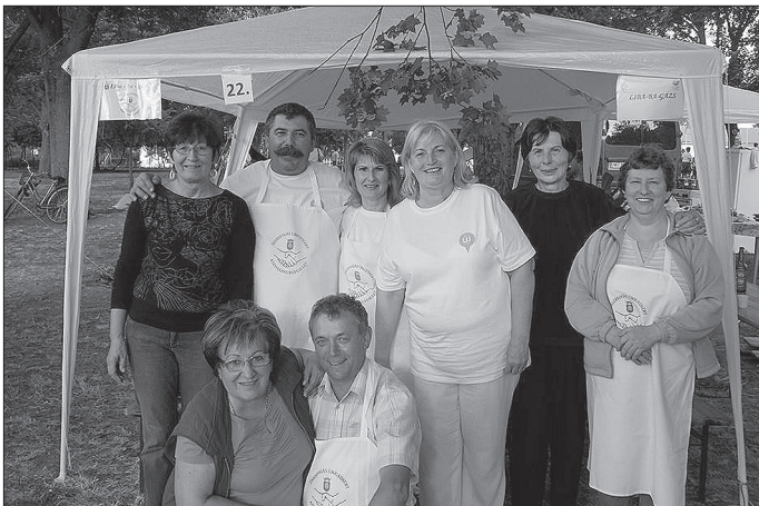
A győztes Liba-ba-gázs csapat és segítők

A szombati program az egész napos főzőversenyre épült, ahol 25 csapat finomabbnál finomabb ételeit pontozta az öttagú zsűri. A képzeletbeli dobogó első fokára a Liba-ba-gázs csapat