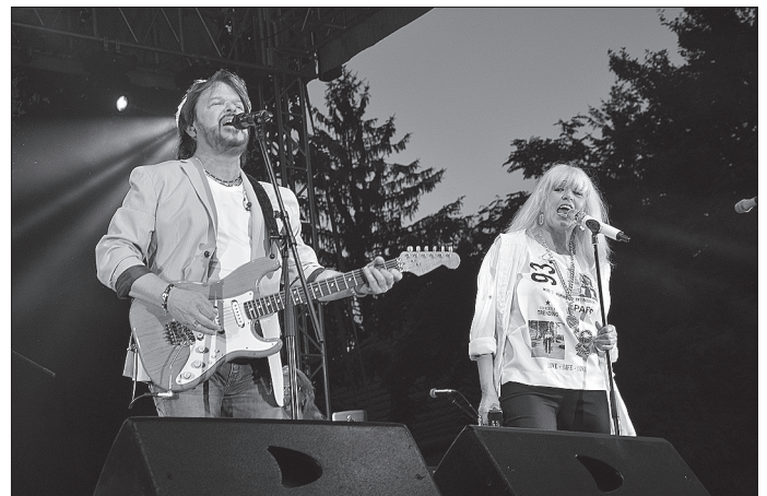
A Neoton Família koncertje sok ezer látogatót vonzott.

nú Egyesület jóvoltából háromnapos egészségprogramban vehettek részt a látogatók, íjászbemutatót tartottak, a gyerekeket