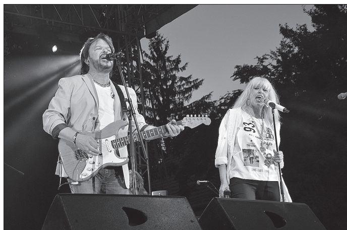
A Neoton Família koncertje sok ezer látogatót vonzott.

nú Egyesület jóvoltából háromnapos egészségprogramban vehettek részt a látogatók, íjászbemutatót tartottak, a gyerekeket