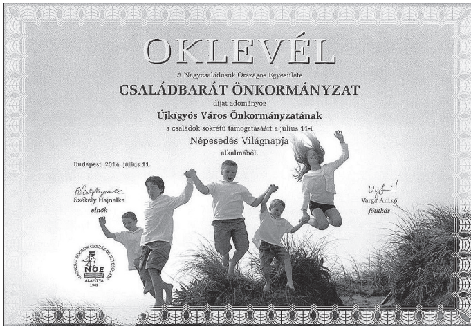
2014-ben négy település kapott Családbarát Önkormányzat díjat

Újkígyós több mint 5000 lakosú település. Magyarország délkeleti részén, Békés megyében, a Körösök völgyében, Békéscsabától 15 km-re fekszik. A város önkormányzatának tevékenységét a családokért, a gyermekekért, az élhetőbb településért a közös együttműködés jellemzi. Az infrastruktúra kiépítettsége az egyik legjobb a térségben. A szilárd útburkolat mellett a főutat kerékpárút kíséri az általános iskoláig, így biztosítva a gyerekek biztonságos közlekedését. Az önkormányzat törekszik arra, hogy a fiatalok a városban maradjanak. A város az ifjú házasságok az első lakáshoz jutásban 150 000 - 300 000 Ft vissza nem térítendő összeggel támogatja. Gyermek születésekor babaértesítőt helyeznek ki a hirdetőablán és a család babaútványban részesül. Minden év őszén továbbviszik a „Minden születendő gyermeknek ültessünk fát” programot. 2013-ban készült el az új bölcsőde, az önkormányzati hivatal épületében babasarok és pelenkázó lett kialakítva.