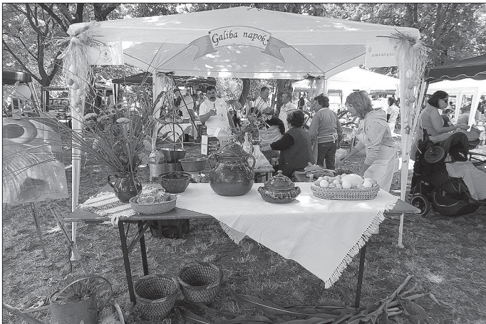
Az „Összefogás Újkígyósiért” Közhasznú Egyesület egészségprogramján kirakodóvásár, népi játékok és népi mesterségek bemutatója is megtalálható volt.

az Újkígyósi Hazaváró keretén belül, az Újkígyósról elszármazottakat és a lakosságot közös ebédre invitálták a szerve-