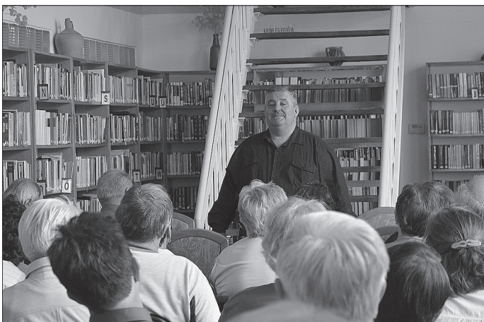
A IV. Szögedi Nemzet Találkozóknak Újkígyós adott otthont.

az Újkígyósi Hazaváró keretén belül, az Újkígyósról elszármazottakat és a lakosságot közös ebédre invitálták a szerve-