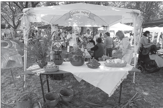
Az „Összefogás Újkígyósiért” Közhasznú Egyesület egészségprogramján kirakodóvásár, népi játékok és népi mesterségek bemutatója is megtalálható volt.

az Újkígyósi Hazaváró keretén belül, az Újkígyósról elszármazottakat és a lakosságot közös ebédre invitálták a szerve-