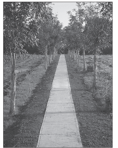
Az új járdaszakaszt gondozott fasor szegélyezi