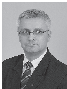
Szebellédi Zoltán polgármester

Az összegzés a képviselő-testület négy éves munkáját mutatja be, lerövidítve az eredeti előterjesztést, mely teljes terjedelmében a www.ujkigyos.hu weboldalon, illetve Újkígyós város hivatalos facebook oldalán, valamint nyomtatott formában a városi könyvtárban és az Újkígyósi Közös Önkormányzati Hivatal ügyféltérben olvasható.