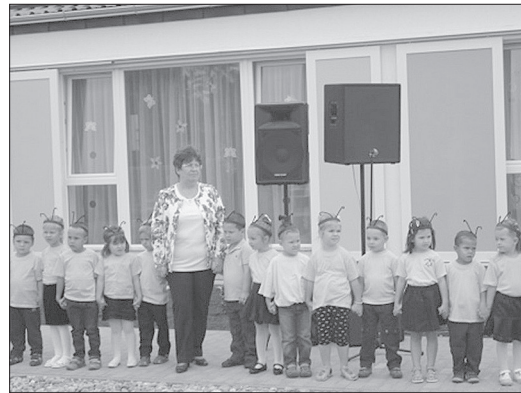
A Méhecske csoport műsorral köszöntötte az új óvodát

Azért sikerült itt Újkígyóson ezt a beruházást is végrehajtanunk, mert voltak helyben olyanok, akik ebben szövetségeseink voltak. A legfontosabb minden ilyen beruházásnál, minden növekedésnél az összefogás. Amikor én államtitkár lettem, Újkígyós polgármestere az első között volt, aki ott volt a szobámban. Elmondta, hogy itt jubileumra készülnek. A város ünnepségeire sikeresen tudott a Nemzeti Kulturális Alaphoz is támogatásért folyamodni. Az elmúlt nyolc évben, mióta polgármester, két milliárd forintnyi összeget tudott idehozni Újkígyóra, ezzel fejlesztve a várost. Ha valaki itt vé-