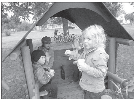
A gyerekek birtokba vették az új házikót