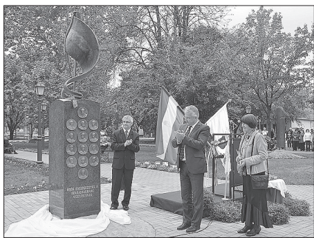
Az emlékművet Gera Katalin, Semjén Zsolt és Szebellédi Zoltán leplezték le

Több mint 20 éve minden képviselő-testület foglalkozott a kérdéssel, hogy új szobrot állítson a régi helyére az