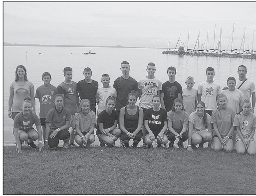
Többen már másodszor táborozhattak Zánkán

Másnap kezdődött a munka. A Magyar Kézilabda Szövetség edzői szoros programot állítottak össze és vezényeltek le: dél-